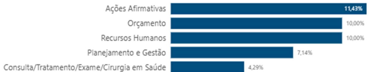
Gráfico 2 - Principais temas solicitados no sistema Fala.br (janeiro a dezembro de 2024)