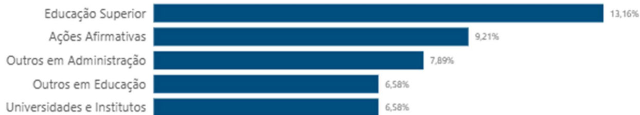
Gráfico 1 - Principais temas solicitados no sistema Fala.br (janeiro a dezembro de 2023)